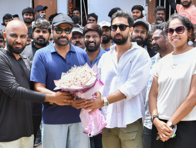
ఫిల్మ్ డెస్క్ (ఫడిఎన్ఎస్):