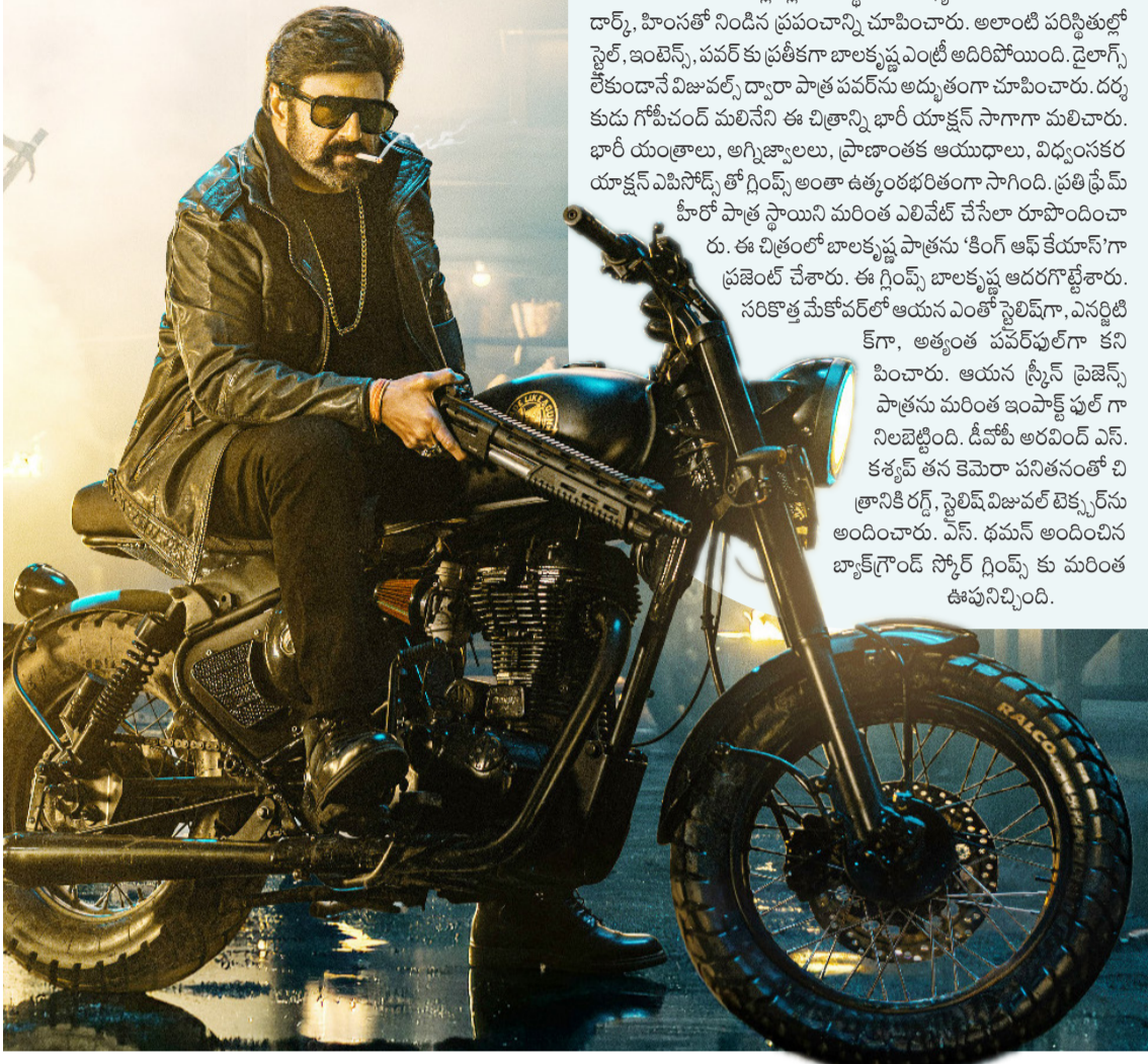
ఫిల్మ్ డెస్క్ (ఫడిఎన్ఎస్):