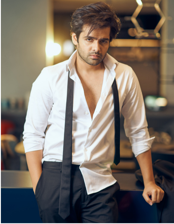
ఫిల్మ్ డెస్క్ (ఫిడీఎన్ఎస్):