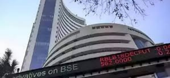
ఇంటర్నేట్ డెస్క్ (పడిఎన్ఎస్):

భారత స్టాక్ మార్కెట్లు ట్రేడింగ్ ముగిసే సమయానికి చివరి గంటలో యూటర్న్ తీసుకున్నాయి. మరోవైపు ఫార్మేట్ మార్కెట్లో భారత రూపాయి విలువ దారుణంగా పడిపోయింది. డాలర్తో పోలిస్తే రూపాయి మారకం విలువ శుభ్రవారం 1.17 శాతం నష్టపోయి 93.75 వద్ద ముగిసింది. ఇది రూపాయి చరిత్రలోనే అత్యంత కనిష్ట స్థాయి కావడం గమనార్హం. అంతర్జాతీయంగా ఇరాన్, ఇజ్రాయెల్ మధ్య యుద్ధ మేపాలు మళ్ళీ కమ్ముకోవడంతో మార్కెట్లు అంటూడి గరిష్టాల నుంచి వెనుక తగ్గాయి. ఇన్వెస్టర్లకు వార్త పలుకుతుంది.