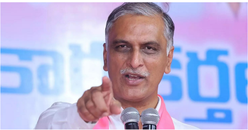
నియోజకవర్గం మధిర సహా పలువురు మంత్రుల నియోజకవర్గాల్లో అత్యధికంగా 4.95 శాతం నుంచి 4.99 శాతం ఎక్సెస్ ధరకు టెండర్లు కట్టబెట్టడం పలు అనుమానాలకు తావిస్తోందని ఆయన ద్వేషమెత్తారు. అలాగే, ముఖ్యమంత్రి వాడుతున్న వాహనం రిజిస్టర్ అయిన సంస్థకి ఏకంగా 9 సూక్ష్మ టెండర్లు ఇవ్వడం వెనుక ఉన్న రహస్యం ఏమిటని ఆయన ప్రశ్నించారు. రాజకీయ పక్షపాతంతో బీఆర్ఎస్ నిట్టిగి ఎమ్మెల్యేలున్న 26 నియోజకవర్గాలకు ఈ సూక్ష్మ

తెలంగాణలో కాంగ్రెస్ ప్రభుత్వం చేపట్టిన యంగ్ ఇండియా ఇంటిగ్రేటెడ్ సూక్ష్మ నిర్మాణంలో వందల కోట్ల కుంభకోణం జరుగుతోందని మాజీ మంత్రి బీఆర్ఎస్ డిప్యూటీ స్పీకర్ బిడర్ హరీశ్ రావు సంచలన ఆరోపణలు చేశారు. అసెంబ్లీలోని బీఆర్ఎస్ ఎంపీల పేర్లతో కార్యాలయంలో శుక్రవారం జరిగిన మీడియా చీట్ చాట్ లో ఆయన మాట్లాడుతూ, టెండర్ల ప్రక్రియలో కాంట్రాక్టర్లు 'అర్బన్ డెవలప్ మెంట్' గా ఏర్పడి ప్రజాధనాన్ని కొట్టేస్తున్నారని మండిపడ్డారు. ఈ స్కామ్ లకు సంబంధించిన పూర్తి ఆధారాలు తన వద్ద ఉన్నాయని, వీటిని అసెంబ్లీ సాక్షిగా బయట పెడతానని ఆయన హెచ్చరించారు. రాష్ట్రవ్యాప్తంగా 76 సూక్ష్మ నిర్మాణానికి ప్రభుత్వం అందంగా వేసిన రూ. 10,199.54 కోట్లను, కాంట్రాక్టర్లు పక్కా ఫ్రాన్స్ లో రూ. 10,693.55 కోట్లకు దక్కించుకున్నారని హరీశ్ రావు ఆరోపించారు. దీనివల్ల సుమారు రూ. 494 కోట్ల అదనపు భారం ప్రజలపై పడుతోందన్నారు. ముఖ్యంగా సీఎం రేవంత్ రెడ్డి నియోజకవర్గం కొండగల్, డిప్యూటీ సీఎం భట్టి విక్రమార్కు