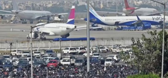
ఇంటర్నేట్ డెస్క్ (పడిఎన్ఎస్):

మధ్యప్రాంతంలో ఉద్రిక్తత నేపథ్యంలో భారత విమానయాన నియంత్రణ సంస్థ అప్రమత్తమైంది. అంతర్జాతీయ విమాన ప్రయాణాలకు భద్రతను దృష్టిలో ఉంచుకుని 11 దేశాల గగనతలం మీదుగా విమాన ప్రయాణాలను తక్షణమే నిలిపివేస్తూ ఆదేశాలు జారీ చేసింది. ఈ దేశాల మీదుగా వెళ్లడం ప్రాణాపాయంతో కూడుకున్నదని, ఏ క్షణమైనా క్షిపణి దారులు జరిగే ముప్పు ఉందని ఏవియేషన్ సంస్థలకు కఠిన హెచ్చరికలు జారీ చేసింది. డిజిటీస్ నిషేధించిన జాబితాలో ఇరాన్, ఇరాక్, ఇజ్రాయెల్, లెబనాన్, జోర్డాన్ వంటి ప్రధాన యుద్ధ ప్రభావిత దేశాలతో పాటు, ఇజ్రాయెల్, కువైట్, ఒమన్, ఖతార్, యూఏఈ తో పాటు సౌదీ అరేబియా వంటి గల్ఫ్ దేశాలు ఉన్నాయి. క్షిపణి దారుల నుంచి రక్షణ పొందేందుకు విమానాలు ప్రయాణించే ఎత్తులను అడ్డుకుని విధించారు. ఒకవేళ అత్యవసర పరిస్థితుల్లో ఈ ప్రాంతాలకు సమీపం నుంచి వెళ్లాలన్న వన్య, FL320 (32,000 అడుగులు) కంటే తక్కువ ఎత్తులో ప్రయాణించవద్దని స్పష్టం చేసింది. అంతకుంటే తక్షణం ఎత్తులను అడ్డుకుని క్షిపణి దారుల బానిస పడే ప్రమాదం ఎక్కువగా ఉంటుందని రక్షణ నిపుణులు హెచ్చరిస్తున్నారు. ఇటీవల ఇరాన్లోని హ్యాంజుత్ లక్ష్యాలుపై అమెరికా, ఇజ్రాయెల్ జరిపిన మెరుపు దారుల తర్వాత, ఇరాన్ ప్రతీకార చర్యలకు దిగవచ్చునని నిరూపణలు భావిస్తున్నాయి. ఈ అంక్షల ప్రభావం భారత్ నుంచి బయటపడి, అమెరికా వెళ్ల ప్రయాణాలపై నేరుగా పడవచ్చును.