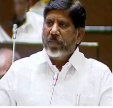
కలుస్తారనే వాస్తవాన్ని తమ ప్రభుత్వం గుర్తించిందని భట్టి పేర్కొన్నారు. తెలంగాణ రాష్ట్రం ఏర్పడిన తర్వాత గత బీఆర్ఎస్ ప్రభుత్వ హయాంలో 347 మంది మావోయిస్టుల లొంగిపోగా, కాంగ్రెస్ అధికారంలోకి

తెలంగాణ అసెంబ్లీ వేదికగా నక్సలైజం అంతం, మావోయిస్టుల లొంగుబాటుకు ఉపముఖ్యమంత్రి, ముఖ్య భట్టి విక్రమార్య కీలక ప్రకటన చేశారు. బడ్జెట్ ప్రసంగంలో భాగంగా హోంశాఖకు రూ. 11,907 కోట్ల కేటాయింపు వెల్లడించిన ఆయన, నక్సలైజం పట్టుకకు కారణమైన సామాజిక, ఆర్థిక అసమానతలను రూపుమాపడం ద్వారానే ఈ సమస్యకు శాశ్వత పరిష్కారం లభిస్తుందని పేర్కొన్నారు. గత ప్రభుత్వాల దీనిని కేవలం శాంతిభద్రతల సమస్యగానే చూశాయని, అయితే కాంగ్రెస్ ప్రభుత్వం సమాజ మూలాలను విశ్లేషించి సామాజిక మార్పు దిశగా అడుగులు వేస్తోందని ఆయన వివరించారు. యువతకు సరైన జీవనోపాధి, సామాజిక గౌరవం, ఆర్థిక భరోసా కల్పించడం ద్వారా అడవుదోకి వెళ్లిన వారు సైతం ఆయుధాల వీడి జనజీవన ప్రపంచంలో