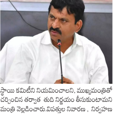
స్థాయి కమిటీని నియమించాలని, ముఖ్యమంత్రితో చర్చించిన తర్వాత తుది నిర్ణయం తీసుకుంటామని మంత్రి వెల్లడించారు. విపత్తుల నివారణ, నిర్వహణ