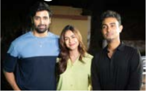
షూటింగ్ కూడా చెబుతున్నారు. ఇటీవలే, చిత్ర నిర్మాతలు రిలీజ్ చేసిన