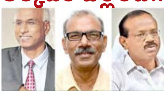
హైకోర్టు తీర్పులో బీజేపీకి చైన్ బెయిల్ సుప్రీంకోర్టు