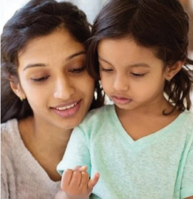
కలవలేరు. ● వీటివల్ల చిన్నతరంలోనే నిద్రలేమి, డిప్రెషన్, దృష్టి లోపం, కోపం, మొండితనం, ట్రామా వంటి సమస్యలు అతిగారాబం, ప్రేమ కేవలం రెండేళ్లవరకే

ఇంటర్నేట్ డెస్క్, (హైదరాబాద్): తల్లిదండ్రులు తమ పిల్లలపై ప్రేమ చూపడం సహజం. కానీ ఆ ప్రేమ అతి గారాబంగా మారి నప్పుడు, అది పిల్లల భవిష్యత్తుకు ముప్పు కలిగించగలదు. నేటి తరం పిల్లల్లో కనిపిస్తున్న స్వతంత్రతలోపం, తప్పులు చేయడం, బాధ్యత తీసుకోలేని స్వభావం, తల్లిదండ్రులపై అధికంగా ఆధారపడటం వంటి లక్షణాలు వెనుక ప్రధాన కారణం "అతి గారాబం" అని నిపుణులు హెచ్చరిస్తున్నారు. మనస్థిర నిపుణులు చెబుతున్నట్లు, పిల్లలకు అన్ని సిద్ధంగా ఇవ్వడం, చిన్న పనికి తల్లిదండ్రులు జోక్యం చేసుకోవడం వల్ల పిల్లల్లో స్వీయ నిర్ణయ సామర్థ్యం తగ్గిపోతుంది. ● విద్యలో, ఆటల్లో, సామాజిక పరిస్థితుల్లో కూడా వారికి అనుకూలంగా ఉండాలనుకుంటారు. ● ప్రతి చిన్న నిర్ణయానికీ భయపడటం లేదా ఏవేవడం అలవాటు అవుతుంది. ● అతి రక్షణ వల్ల పిల్లలు ఇతరులతో అంత త్వరగా