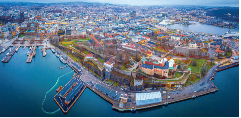
నగరం ఉంది. అల్బర్టా నగరంలో అక్టోబర్ 24, 2025 నాటికి ఎయిర్ క్వాలిటీ ఇండెక్స్ 11గా ఉంది. ● బోర్నో: కెనడాలోని బోర్నో నగరం నాలుగో స్థానంలో నిలిచింది. అక్కడి గాలి నాణ్యత 11గా ఉంది. ● సిడ్నీ: గాలి నాణ్యతలో ఆస్ట్రేలియాలోని సిడ్నీ నగరం బెస్ట్ స్థానంలో ఉంది. ఇక్కడి గాలి నాణ్యత 16గా ఉంది. ● కాలాలంపూర్: మలేషియాలోని కాలాలంపూర్ అరబ్ స్థానంలో ఉంది. ఇక్కడ అడవుల దహనం కూడా అధికంగా ఉన్నాకూడా, విద్యుత్ ట్రాన్సిక్

ఇంటర్నేట్ డెస్క్, (హైదరాబాద్): ప్రపంచవ్యాప్తంగా పోల్యూషన్ పెరిగిపోతోంది. ప్రభాత లో కూడా ప్రతి ఏడాది చలికాలంలో దేశరాజధాని ఢిల్లీ వాయు కాలుష్యంతో అక్కడకు వచ్చింది. ఈ సమస్యను తీర్చడానికి అనేక ప్రయత్నాలు చేస్తున్నారు. ఇలాంటి పరిస్థితులలో స్వచ్ఛమైన గాలి పీల్చుకోవాలంటే ప్రపంచంలో ఢిల్లీ ఎయిర్ క్వాలిటీ ఇండెక్స్ గల నగరాలకు వెళ్లాలి. అక్కడి పరిశుభ్రమైన గాలి ఈ నగరాలను పోల్యూషన్ ఫ్రీ నగరాలుగా మార్చింది. ● నార్వే: నార్వే దేశంలోని ఓస్లో నగరం ప్రపంచంలోనే ఎయిర్ క్వాలిటీ ఇండెక్స్ లో అగ్రస్థానంలో ఉంది. ఇక్కడి ఎయిర్ క్వాలిటీ 11గా ఉంది. ఓస్లోలోని దాహాఫ్ 90 శాతం వాహనాలు ఎలక్ట్రిక్ వాహనాలు. చివరికి ఉన్నట్లు, రైళ్లు, ఇతర వాహనాలు కూడా పూర్తిగా 2028నాటికి పూర్తిగా వాయుకాలుష్యం బారిన ఉండి గ్రీన్ ఎనర్జీకి మారుతాయి. ● డెట్రాయిట్: రెండో స్థానంలో అమెరికాలోని డెట్రాయిట్ నగరం ఉంది. ఈ నగరం కాలంలో అత్యంత కాలుష్యం కలిగిన నగరాల్లో ఒకటిగా ఉంది. అనేక సంవత్సరాల ప్రచారం, అభివృద్ధి తర్వాత నగరంలోని మునిసిపల్ సౌలీజ్ వెస్ట్ ను నిషేధించారు. దీనితో డెట్రాయిట్ ఎయిర్ క్వాలిటీ ఇండెక్స్ 8 కి చేరింది. ● అల్బర్టా: మూడో స్థానంలో అల్బర్టాలోని అల్బర్టా