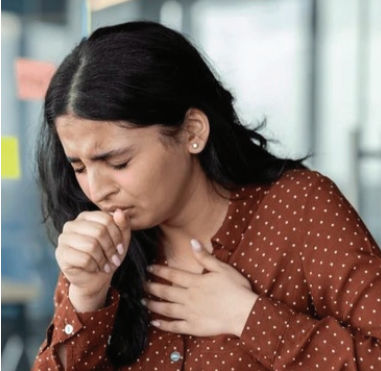
తగ్గునుకోవచ్చు. తడి దగ్గులో కళ్ల పడుతుంది. ఇది అస్పైర్మిటిస్ కూడా బాధిస్తుంది. బయటకు తోసి ప్రయత్నం చేస్తుంది. బ్రాంకైటిస్, జలుబు, ప్లూ, న్యూమోనియా, కొవిడ్ వంటివి తడిదగ్గులు. చాతీల్లో భారంగా అనిపించడం, వ్యాధిసాధు శ్వాస తీసుకోవడంలో ఇబ్బంది, దగ్గుతో పాటు కప్పం రావడం దీని లక్షణాలు. గోరువెచ్చని నీరు తరచూ తాగడం, కప్పం బయటకు రానివ్వాలి అడ్డుకోవడం. దగ్గుకు తగిన మందులు వాడాలంటే అది ఏరకంగా తెలుసుకోవాలి. దానిని బట్టి వైద్యుల సలహా మేరకు మందులు వాడాలి. నాలుగేళ్ల లోపు చిన్నారులకు దగ్గు సర్పెట్ లు వాడక పోవడమే మంచిది. దగ్గు 2 వారాలకు మించి కొనసాగితే డాక్టర్ ను సంప్రదించడం మంచిది. జ్వరం, చాతీ నొప్పి, రక్తంతో దగ్గు, శ్వాస తీసుకోవడంలో ఇబ్బంది వంటి లక్షణాలు ఉంటే వెంటనే వైద్యుడిని సంప్రదించాలి.

ఇంటర్నేట్ డెస్క్, (హైదరాబాద్): దగ్గు వచ్చిందంటే తెగ చిరాకు పెట్టేస్తుంది. నిద్రపో నివ్వదు, పనిచేసేసేసే వచ్చదు. మాట్లాడనివ్వదు. ముఖ్యంగా వర్షాకాలం ఈ దగ్గు వచ్చిందంటే ఓపికైన తగ్గుడు. ఒక విధంగా అనేది శరీర రక్షణ చర్య. మన శ్వాసనాళాల్లో దుమ్ము, నూకలైతులు లేదా కప్పం పేసు కుపోతే, వాటిని బయటికి పంపడానికి దగ్గు వస్తుంది. ఈ దగ్గు రెండు రకాలుగా ఉంటుంది. పొడి దగ్గులో కళ్ల పడడు, కానీ గొంతులో చిరాకుగా, దురదగా ఉన్నట్లుంటుంది. అల్ట్రా ఫైన్, ఉబ్బసం, పొడిగాలి, కొన్ని రకాల మందులు ఈ దగ్గుకు కారణమవుతాయి. గోరువెచ్చని నీటిలో ఉప్పు వేసి గార్జిల్ చేయడం, తేనె, అల్లం, నిమ్మరసం కలిపి తాగడం, ఆవిరి పీల్చడం, తగినంత నీరు తాగడం వంటి పనులతో ఈ దగ్గును